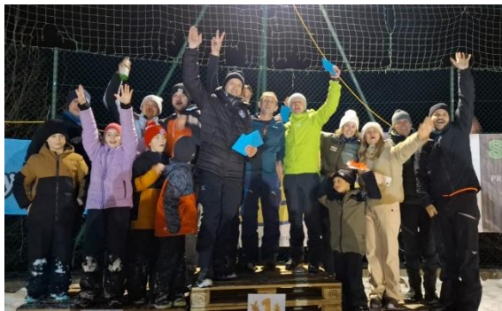
Team Tirol siegt in Kitzbühel beim Junior Race